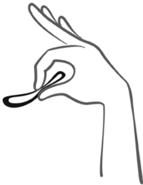
Obrázek 2 Zmáčkněte kroužek.